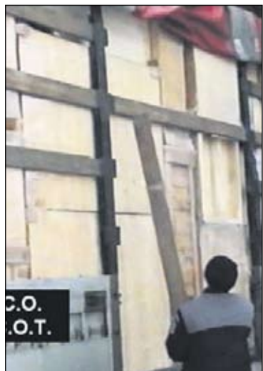
Titkos raktárban tárolták a cigarettákat

A Bihar megyei rendőrség munkatársai a terrorizmus és pénzmosás ellenes szolgálat, valamint az ügyészséggel és a hírszerzéssel együttmű-